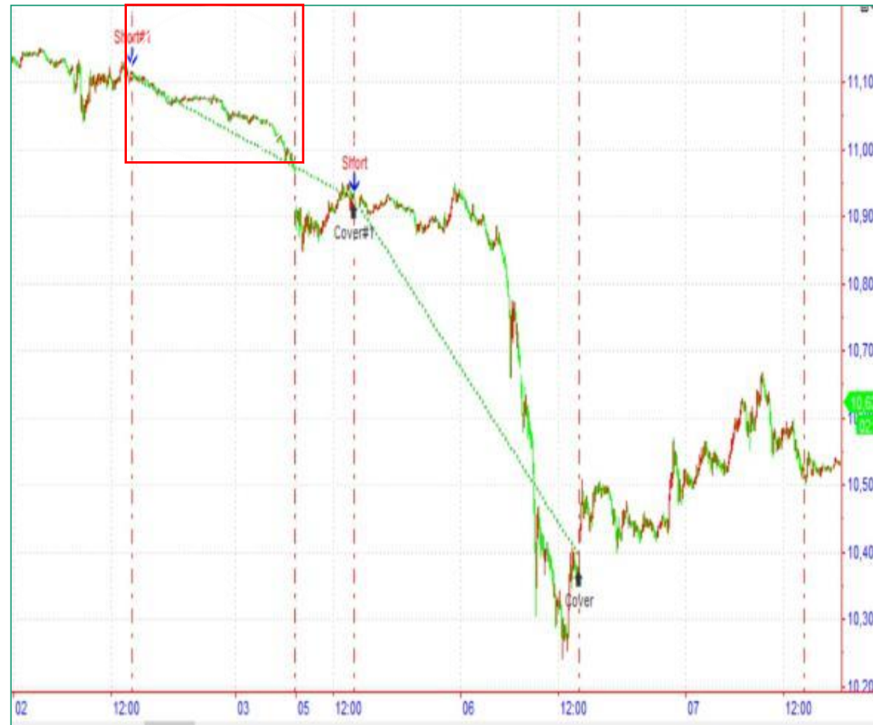
2018 --02/05~02/06 大波段行情，完全提取，不論投資策略或避險都可以應用